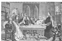
John Wesley (1703-1791)

Kebanyakan pembaharuan yang telah terjadi di sepanjang sejarah gereja dimulakan oleh kelompok-kelompok kecil. Terdapat ramai individu seperti Fransiskus dari Assisi yang berkumpul di dalam kelompok kecil untuk berdoa, belajar, berlatih dan melayani sewaktu Zaman Pertengahan. Salah satu contoh yang terbaik ialah kelompok kecil yang membentuk kebangkitan rohani Methodist. John Wesley membahagikan kelompok-kelompok kecil itu kepada Society , Class dan Bands untuk membantu membangun iman orang baru percaya. Struktur kelompok dan perjumpaan kelas yang dilakukan oleh gereja Methodist merupakan kebangkitan dan kebangunan rohani yang paling lama di dalam sejarah gereja sehingga hari ini.